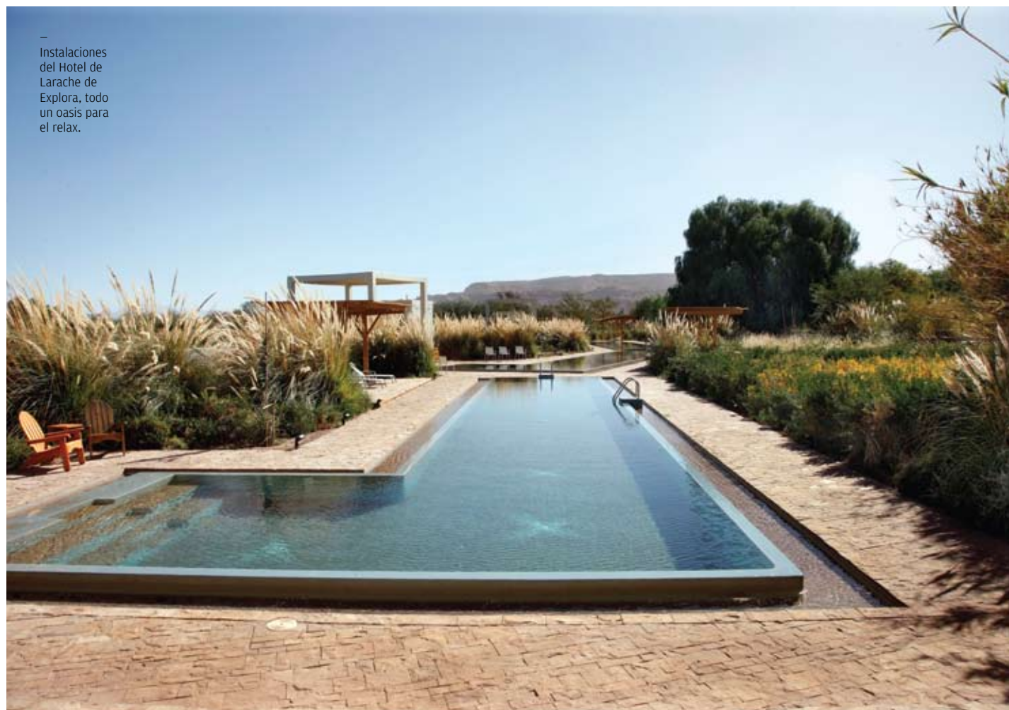
Instalaciones del Hotel de Larache de Explora, todo un oasis para el relax.