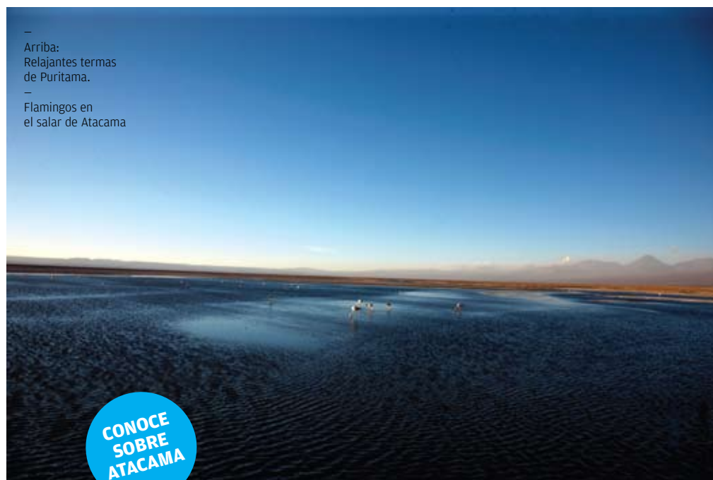
— Arriba: Relajantes termas de Puritama.

¿QUÉ SE PUEDE HACER PARA SEGUIR ALIMENTANDO EL ESPÍRITU Y ENCONTRANDO EL RELAX? PUES VISITAR LAS TERMAS DE PURITAMA, EN DONDE LAS AGUAS CALIENTES DEL RÍO HOMÓNIMO SIRVEN PARA DISFRUTAR DEL MARAVILLOSO CONTRASTE ENTRE LAS ROCAS ROSADAS, EL CIELO AZUL Y LAS HOJAS BLANCAS DE LA VEGETACIÓN DESARROLLADA ALLÍ POR EXPLORA