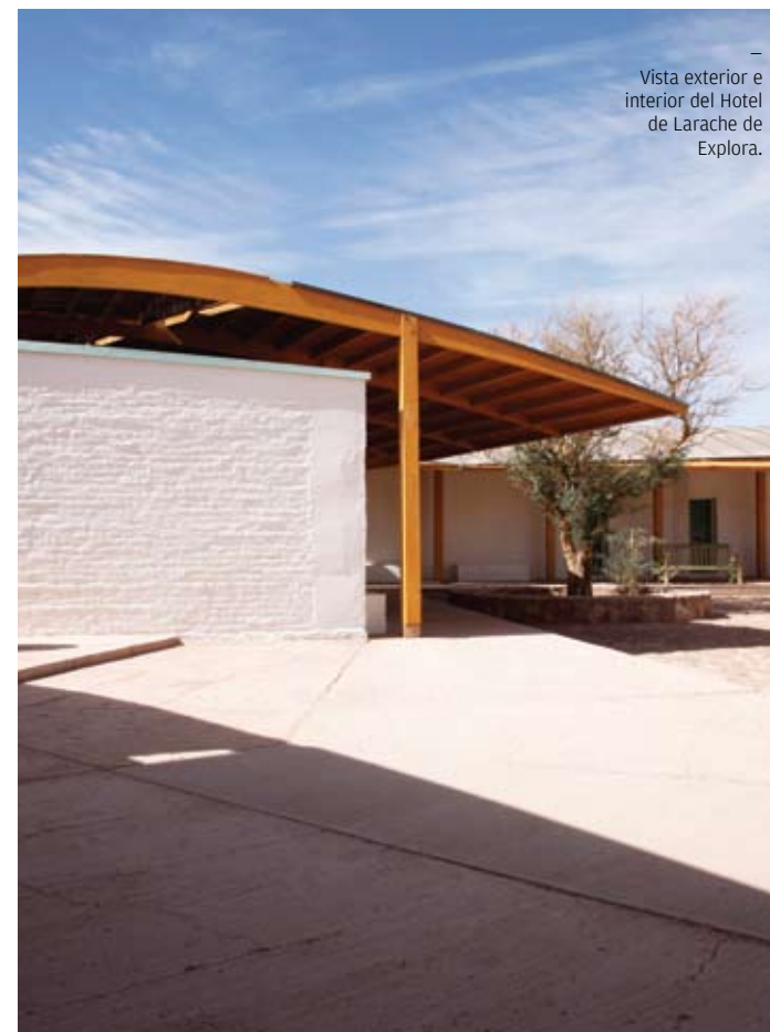
— Vista exterior e interior del Hotel de Larache de Explora.