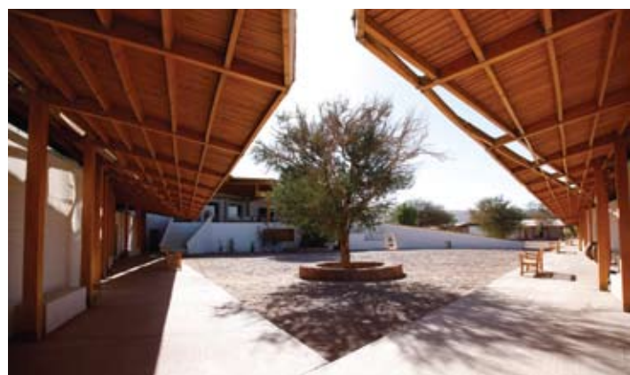
El Valle de la Luna y pasillo exterior del hotel.