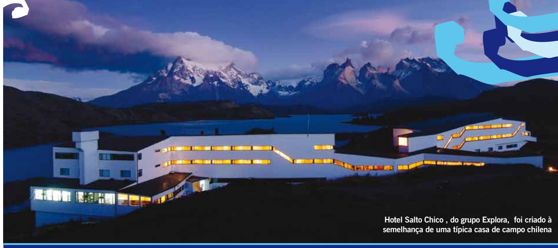
Hotel Salto Chico, do grupo Explora, foi criado à semelhança de uma típica casa de campo chilena

O ideal é você poder levar, pelo menos, dois pares de tênis impermeáveis, meias grossas e confortáveis, e se você for muito sensível ao frio aposte num par de sapatos forrados de pele. Jaquetas e moletons são indispensáveis (preferencialmente impermeáveis) bem como roupas de baixo térmicas. Só não esqueça das luvas e do capuz. Para este último, prefira o estilo ninja ou você vai sentir o vento forte nas bochechas. Caso esqueça algo no aeroporto de Punta Arenas, tem uma lojinha com alguns itens para o frio (luvas e cachecóis) próxima à porta de saída (a que fica mais próxima aos sanitários é a mais cara), e o próprio Explora oferece no Hotel Salto Chico uma ótima lojinha.