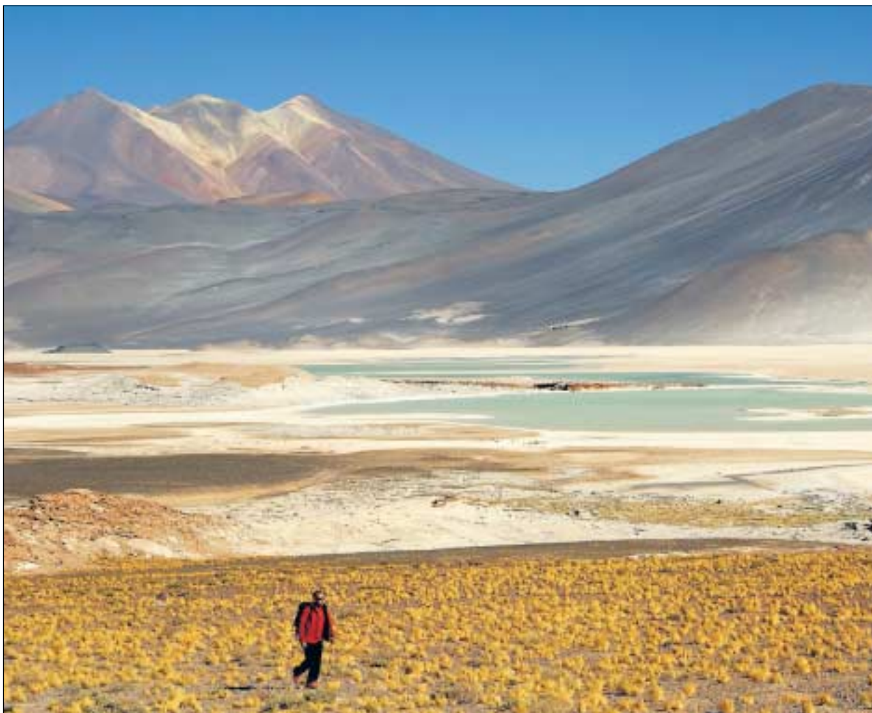
Blick auf den Salzsee Salar de Talar im Südosten der chilenischen Atacama-Wüste.

Wenn die Gäste abends erschöpft und euphorisiert ins Hotel zurückkehren, erwartet sie die offene Bar zum Apéro. Daneben sitzen Guides mit Gästen an Glastischen über Karten, um den nächsten Tag zu planen. Insgesamt bietet Explora in Atacama fast 40 Ausflüge an. Im oberen Stock des grosszügig konzipierten, in einem modern interpretierten Ranch-Stil gehaltenen Hotels findet sich eine Open-Air-Lounge, von der aus der Sonnenuntergang betrachtet werden kann. Die Andengipfel im Osten werden dann in ein spektakuläres Farbleid aus Orange, Pink und Rot getaucht. Und wem die Weite dieses Ausblicks nicht genügt, der kann abends ins hauseigene, zwei Millionen Dollar teure Observatorium wandeln, wo den Gästen die Preziosen des Weltalls vor Augen geführt werden. Dort sehen sie dann die Oberfläche des Mondes, und denken vielleicht, dass das Valle de la Luna vom Nachmittag eigentlich viel schöner ist als das Original. Roberto Zimmermann