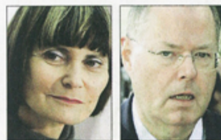
Micheline Calmy-Rey, Peer Steinbrück

Aussenministerin Micheline Calmy-Rey und Volkswirtschaftsministerin Doris Leuthard haben derweil am Samstag ihre Kritik am deutschen Vorgehen bekräftigt. «Es geht offenbar darum, dass Deutschland Geld braucht.