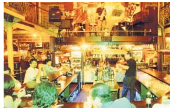
Die Bar «Muneca Brava» im Quartier Bellavista.