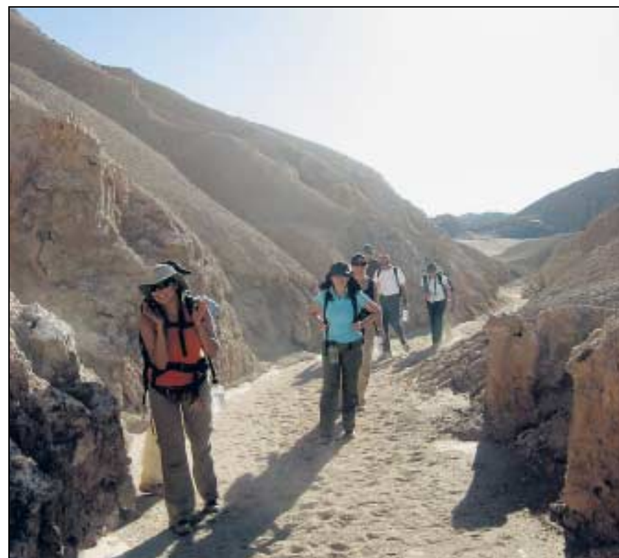
Wandergruppe im Valle de la Luna, das westlich der Ortschaft San Pedro liegt. (roz.)

www.explora.com www.visitichile.com/eng/destinations.asp