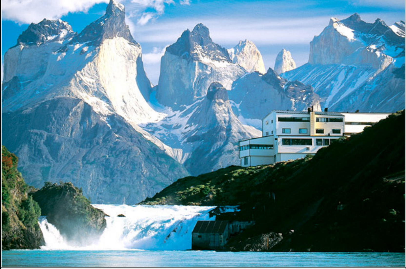
Vista panorâmica do hotel Salto Chico

Você deve se logar para postar um comentário.