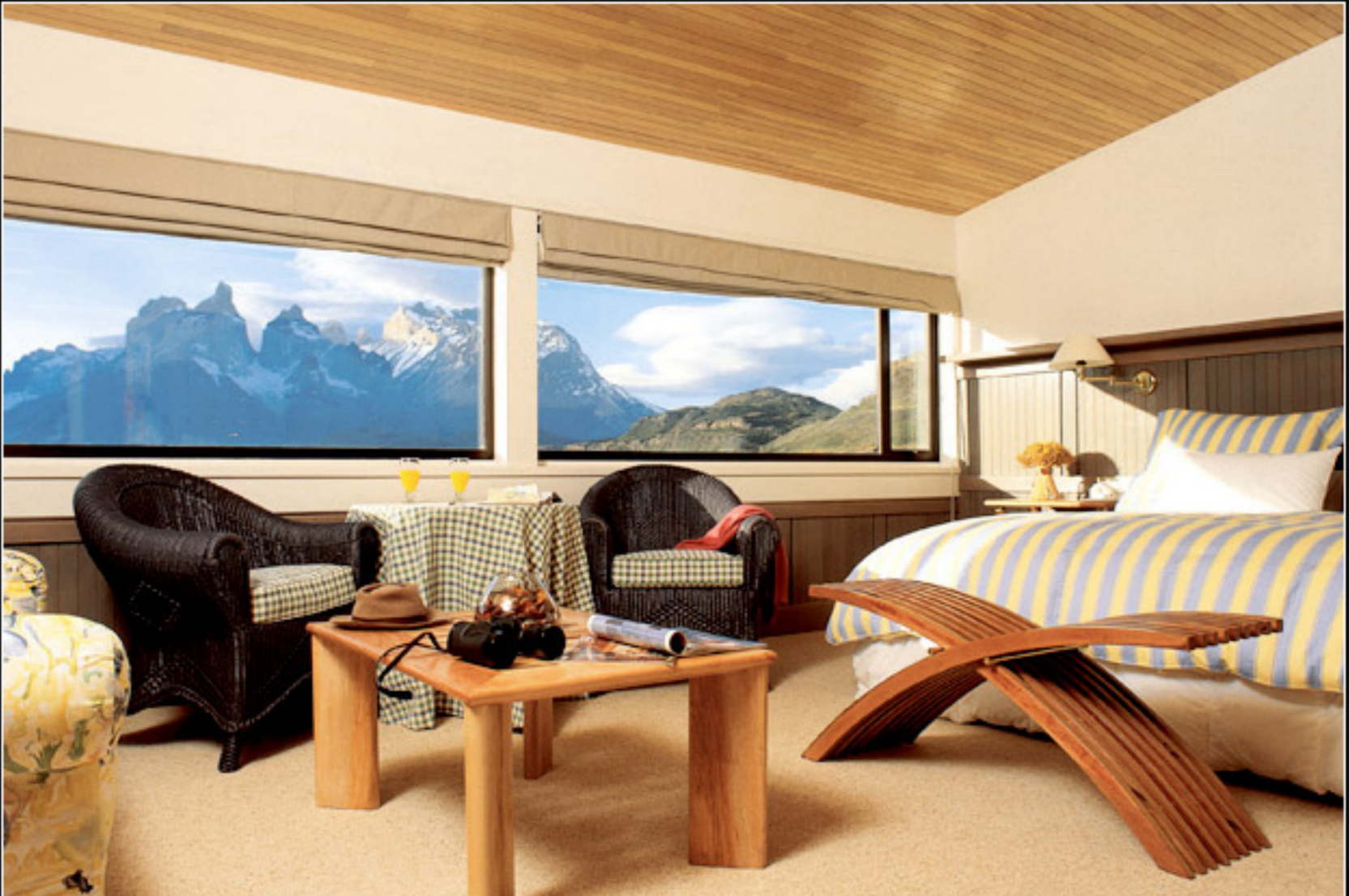
Vista panorâmica do quarto do hotel Salto Chico

Você deve se logar para postar um comentário.