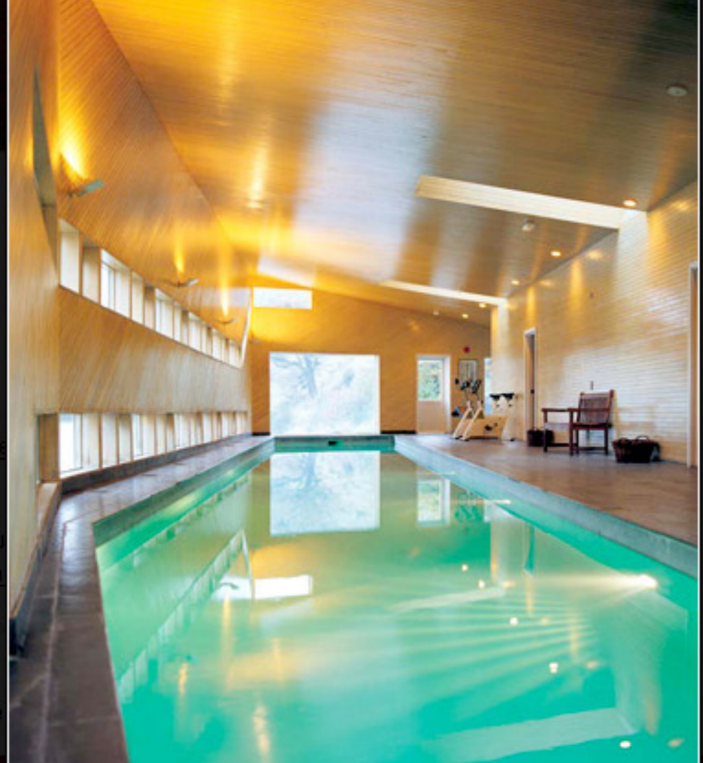
Piscina indoor na área de spa do Salto Chico

Você deve se logar para postar um comentário.