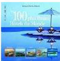
Guide des 100 plus beaux hôtels du monde