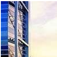
Burj Al Arab- Dubai