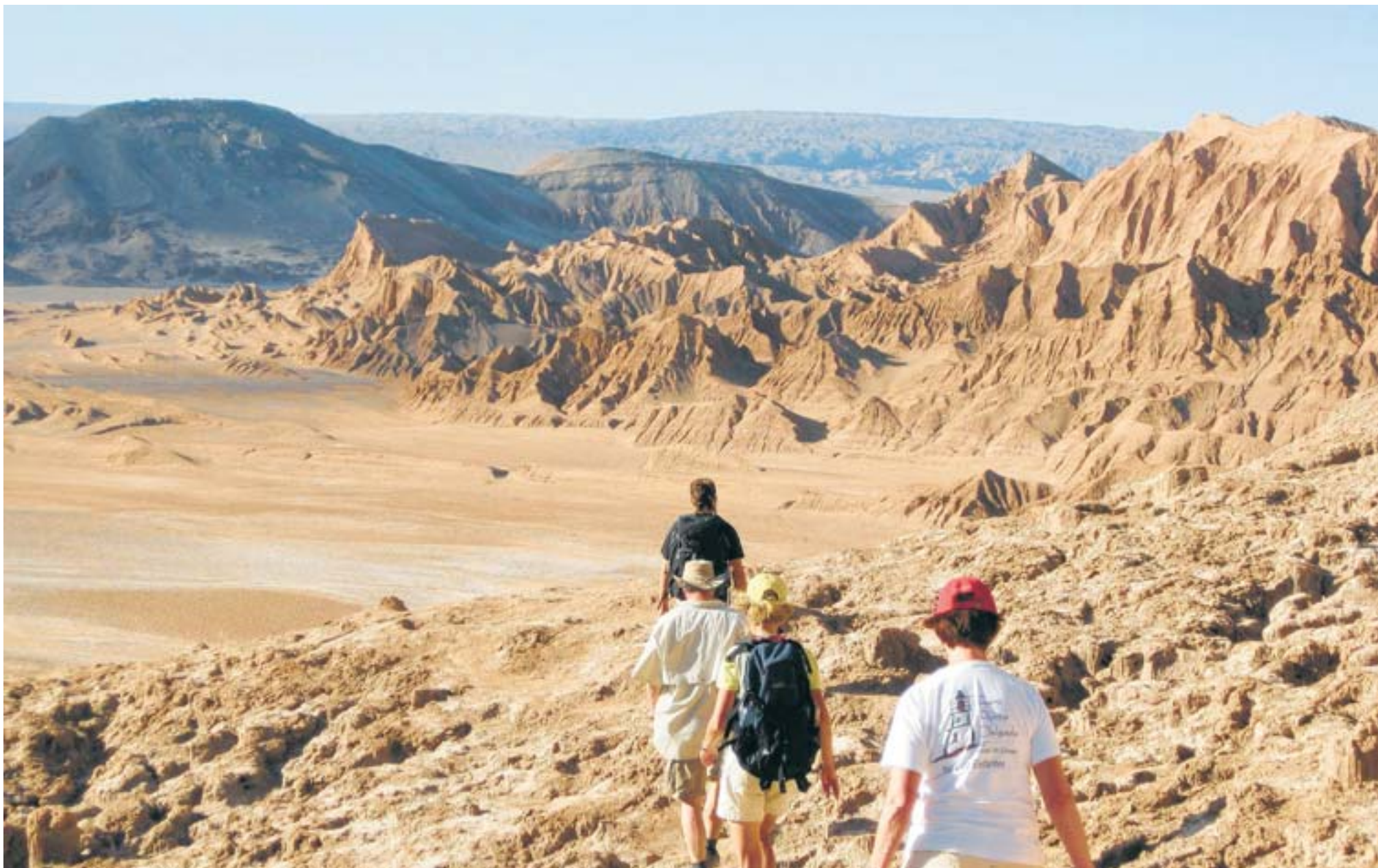
Spektakulär Bizarre Felsformationen, salzverkrustete Gebirgshänge, Sandflächen und Ockerfarben im „Valle de la Luna“ – Tal des Mondes.