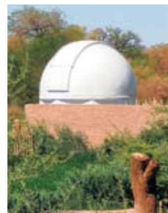
Einmalig Eigene Sternwarte in der Hotelanlage.

INFO explora Atacama wird von deutschen Reiseveranstaltern als „Premium“ angeboten. Mindestaufenthalt drei Nächte. Preis bei Dertour 1367 Euro pro Person für Vier-Tage-Programm. www.explora.com