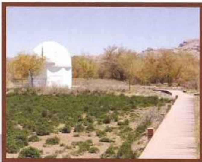
Explora Atacama: suítes com 50 metros quadrados, terraço privativo, sauna e piscina a ar livre

Se o Atacama já é um destino digno de sonhos, o Explora traz um plus para quem ama admirar as estrelas. Com sua privilegiada localização na América do Sul, elevada altitude, um céu virtualmente sem nuvens e baixa densidade populacional, minimizando as interferências de luz e de rádio, o local pode ser traduzido como um imenso camarote para observar os astros celestes. O plus do hotel é a recente instalação do telescópio profissional Meade LX200R, moderno e de última geração, equipado com uma lente ótica de grau superior – está classificado como um dos maiores telescópios amadores do Chile. O observatório do Explora está situado a 100 metros do Hotel de Larache. Lá, os hóspedes se reúnem sob um domo e, pelos "olhos" do Meade, podem viajar por diferentes constelações, galáxias e planetas. ■