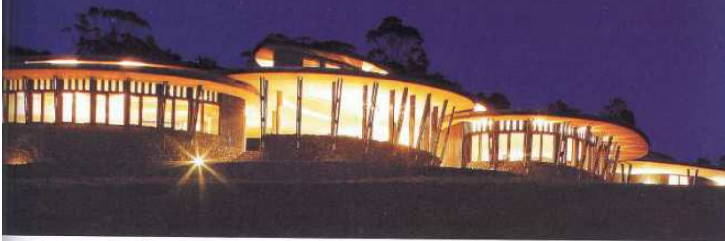
ACIMA E ABAIXO, O EXPLORA EN RAPA NUI, HOTEL DE ALTO LEXO COM VISTA PARA A HISTÓRIA ANCESTRAL DA ILHA DE PÁScoa