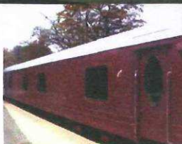
Cordillère des Andes avec Explora.

Pour en savoir plus, reportez-vous au Cahier Pratique Monde du Voyage en fin de numéro.